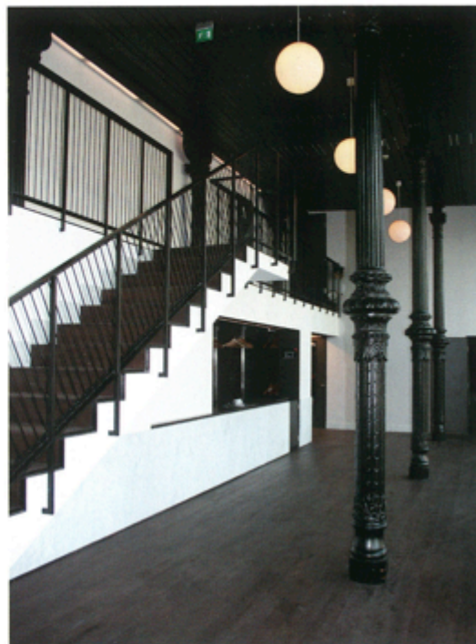
KÄGELBANAN på Mosebacke på Södermalm fick en ansiktslyftning nyligen.

– Jag reagerade kraftigt på att man inte hade kunnat hitta en bättre lösning för en sådan unik plats. Jag såg hur hierarkierna i arkitekturen avspeglade sig i den kultur som fanns och fortfarande finns i Fisksätra: segregationen och bristen på inkänning och närhet till människornas villkor. Jag började fundera mycket på de här frågorna. Efter ett tag lade jag ner mer tid på att möblera om klassrummet, eftersom jag märkte på vilket tydligt sätt det påverkade barnen, än på själva undervisningen. Det var väl där någonstans jag insåg att det var dags att byta karriär.