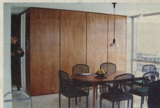
Inbyggd förvaring gör rummen lättmöblerade. Bilden är hämtad från Mies van der Rohes penthouse i Chicago, en exklusiv lägenhet med lösningar som även kan användas i mer vardagligt byggande.